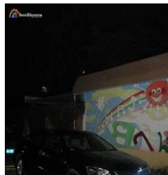
Con illuminatore acceso