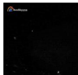
Con illuminatore spento